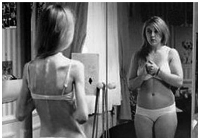
Ryc. 3. Wizja chorej na anoreksję w lustrze [5, 18]